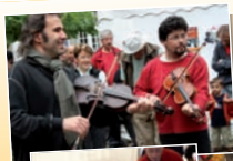
Coill. La Loure

La préparation du sirop va jalonner toute la fête. Le samedi matin, épluchage collectif des pommes ; le samedi après-midi, début de la cuisson qui va durer jusqu'au dimanche après-midi sans discontinuer. Autour du sirop, chansons, musiques, contes et causeries... Le point névralgique de la fête !