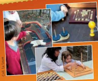
Coill. La Loure

Jeux en bois, jeux d'adresse ou de hasard... Autant de jeux – plus ou moins traditionnels – que vous fera découvrir l'association Payaso Loco , habituée des veillées de jeux en Pays de Haute-Mayenne.