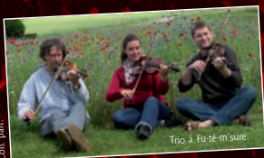
Trio à Fu-té-m'sure